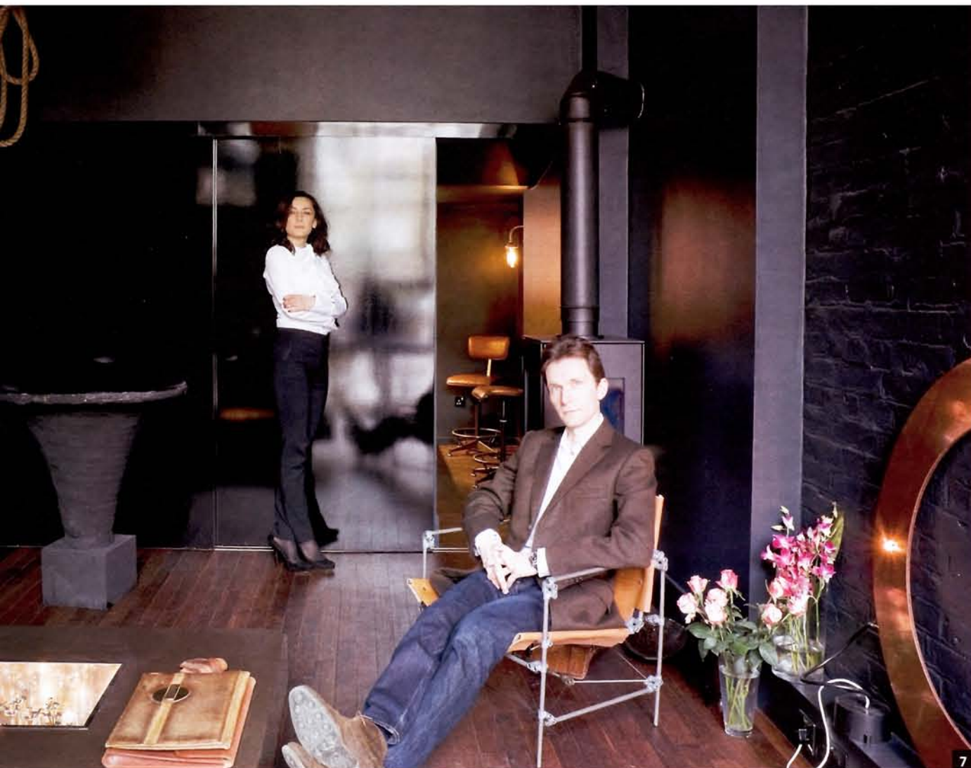
7 Брат и сестра в готовото студио на невролога.